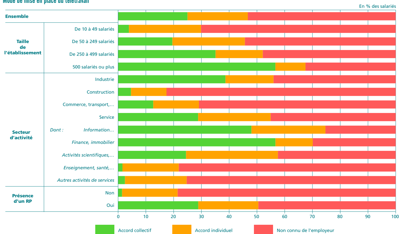
Graphique 2 Mode de mise en place du télétravail

Note : dans l'enquête Reponse, les salariés ont déclaré exercer tout ou partie de leur activité en télétravail sans préciser sa fréquence, régulière ou non. Lecture : 25 % des télétravailleurs travaillent dans un établissement où existe par un accord collectif sur le télétravail ; 22 % sont dans des établissements où l'accord sur le télétravail est uniquement individuel. Pour 53 % des télétravailleurs, la direction déclare que cette pratique n'existe pas dans leur établissement. Champ : salariés des établissements de plus de 10 salariés, secteur privé non agricole, France métropolitaine.